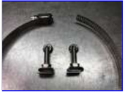
締め付けバンドと連結ボルト