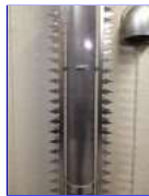
ギザギザハートを2本取付