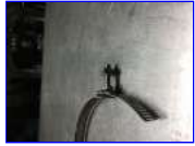
バンドに通します