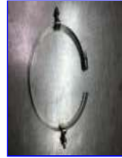
2個装着でも1セット