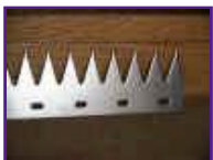
折り曲げの無いタイプ