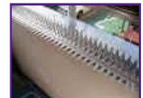
曲げ無しタイプと規格品を重ねてみました。