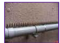
パイプ専用金具（1セット2000円）を使用してパイプに取付。横引配管の忍び返し（鳩よけ）になります。