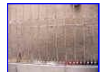
忍び返しと同時に設置すれば塀に手をかけられません。当然、侵入の危険性も限りなくゼロに！

●取付について 6.5x19mmのルーズ穴が50mm間隔で開いてますので、6mmのビスナット、カール、テクスなどで躯体に固定してください。